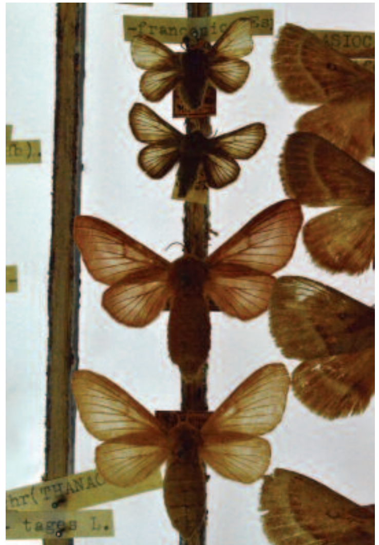
Esemplari di Malacosoma francisco ottenuti da bruchi in allevamento.